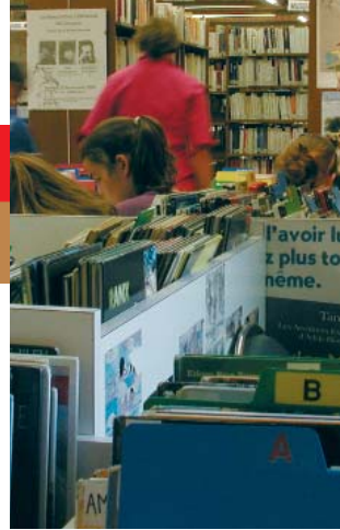
MÉDIATHÈQUE CECCANO AVIGNON © SALLUCES