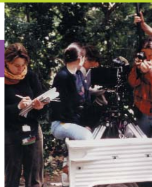
TOURNAGE "AH ! LES BEAUX DIMANCHES"