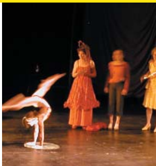
CIRQUE PLUME - J4 L'ESCALE DU CIRQUE 2002