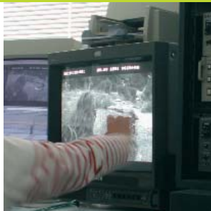
SALLE DE POSTPRODUCTION