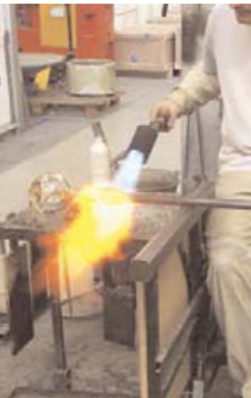
DIRVA © J. C. LETT