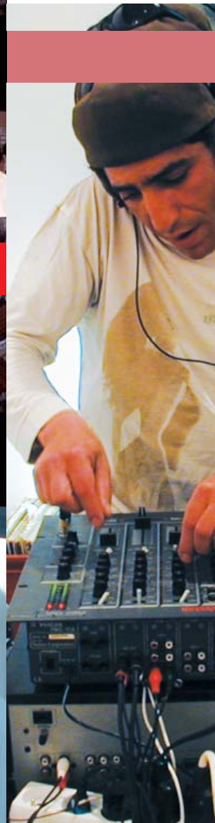
DJ AMAR