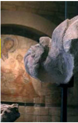
PALAIS DES PAPES - AVIGNON