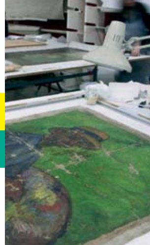
ÉCOLE SUPÉRIEURE D'ART D'AVIGNON