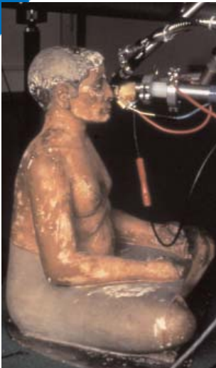
LE SCRIBE ACCROUPI