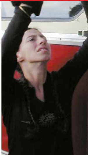
TOURNAGE "TITINERIS WAP"